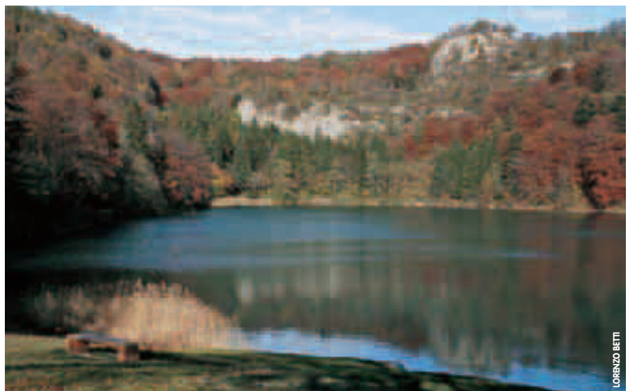
Nei laghi di Lases, Serraià, Terlago, Santo e di Lamar (nella foto) è consentita la cattura giornaliera di non più di 5 capi tra tinche, carpe, anguille, lucci e coregoni (di cui al massimo 2 lucci e tre coregoni).