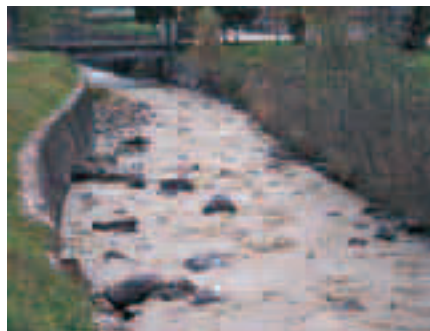
Gli effetti sul Noce Bianco del disastroso svaso di Malga Mare.