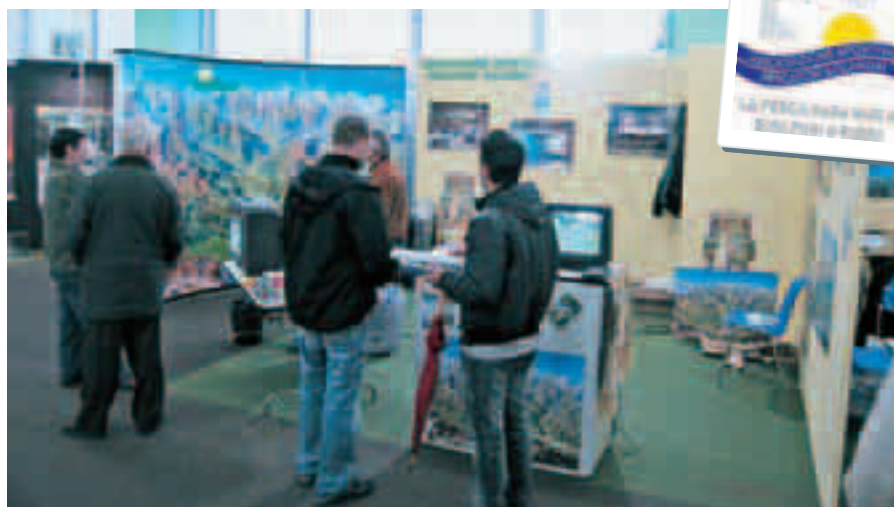
Lo stand dell'A.S.P.S. a Riva del Garda nel 2007.

Si è poi trattata anche l'annosa questione del rilascio di limo dalla valle di Malga Mare; limo che distrugge la microfauna del torrente Noce in tutta la val di Peio fino alla confluenza con la Vermigliana a Fucine, compromettendo inesorabilmente il nutrimento e la riproduzione delle trote. Ne è prova anche quest'anno il fatto che durante le operazioni di recupero ittico, in val di Peio si sono raccolti solo 20 esemplari, mentre nelle zone non interessate al rilascio come in alta val di Rabbi, in zona Parco, le catture sono state ben 1100. Si auspica quindi un incontro con l'Enel e i rap-