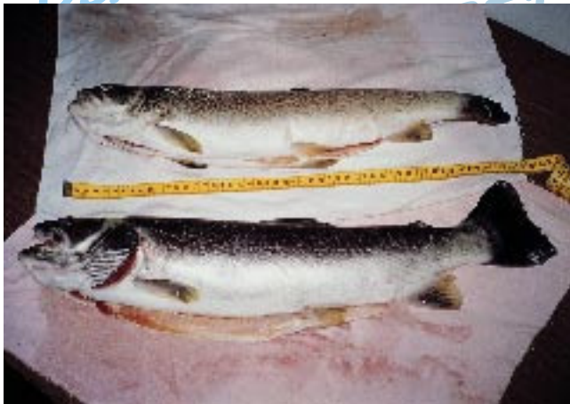
Due esemplari di Trota marmorata di 2,500 kg e 2,220 kg pescate nel Torrente Avisio nella bassa Valle di Cembra (A.P.D.T. - zona C2)