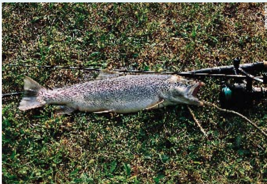
La Trota marmorata, la vera trota dell'Adige.

Da qualche anno siamo entrati in un terzo tempo, che definirei del ricupero, ricupero, badate bene, reso possibile dalle migliorate condizioni dell'acqua, non tanto dell'ambiente; intendendo dire che se le condizioni dell'acqua sono tali da permettere la vita e lo sviluppo della fauna ittica autoctona, le condizioni ambientali, come fondo del fiume e repentini sbalzi di livello, non consentono una normale ripresa della riproduzione naturale che dovrà pertanto essere integrata